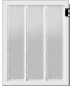
OILEX Pad 3k-60v