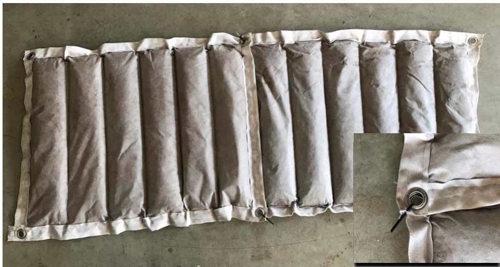
연결된 OILEX Pads

*OILEX 흡착제는 100% 유기물이며, 소수성 생물 퇴적물로 구성되어 일부 기술자료는 약간 상이할 수 있으며, 흡착되어야 하는 물질에 따라 그 흡착 효과는 다를 수 있음. 폐기할 경우 해당 폐기물 처리법을 준수하여야 함.